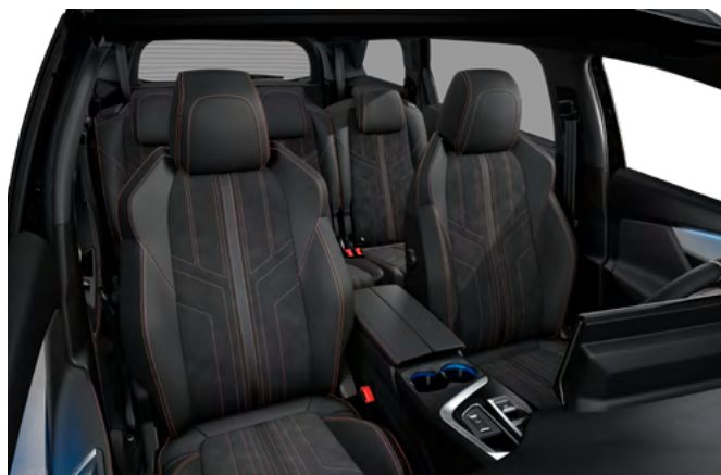
Unutrašnjost u kombinaciji TEP sa "Alcantara® Mistral" i Aikinite šavom