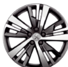
Aluminijumska felna 18" DETROIT