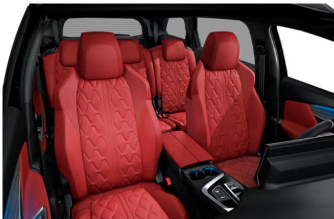
Nappa crvena kožna unutrašnjost sa "Aikinite" šavom