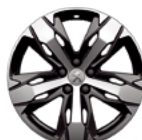
Aluminijumska felna 18" LOS ANGELES