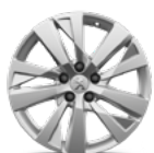
Aluminijumska felna 17" CHICAGO