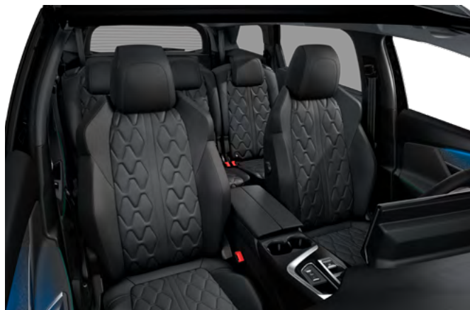
Nappa crna kožna unutrašnjost sa "Tramontane" šavom