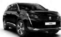
Crna Perla Nera