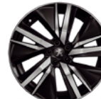
Aluminijumska felna 19" SAN FRANCISCO