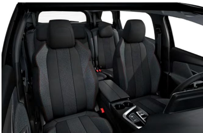
Tamna unutrašnjost od tkanine Meco