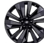
Aluminijumska felna 19" WASHINGTON